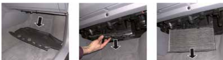
Рис. 1 – Салонный фильтр, расположенный в бардачке