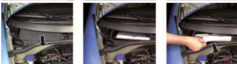
Рис. 2 – Салонный фильтр, расположенный в моторном отсеке, под ветровым стеклом