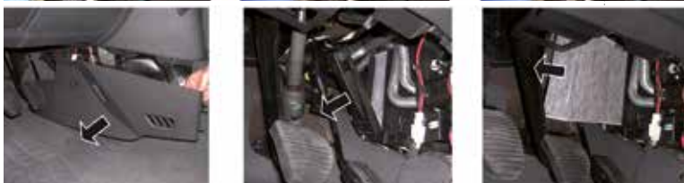
Рис. 3 – Салонный фильтр, расположенный рядом с педалями.